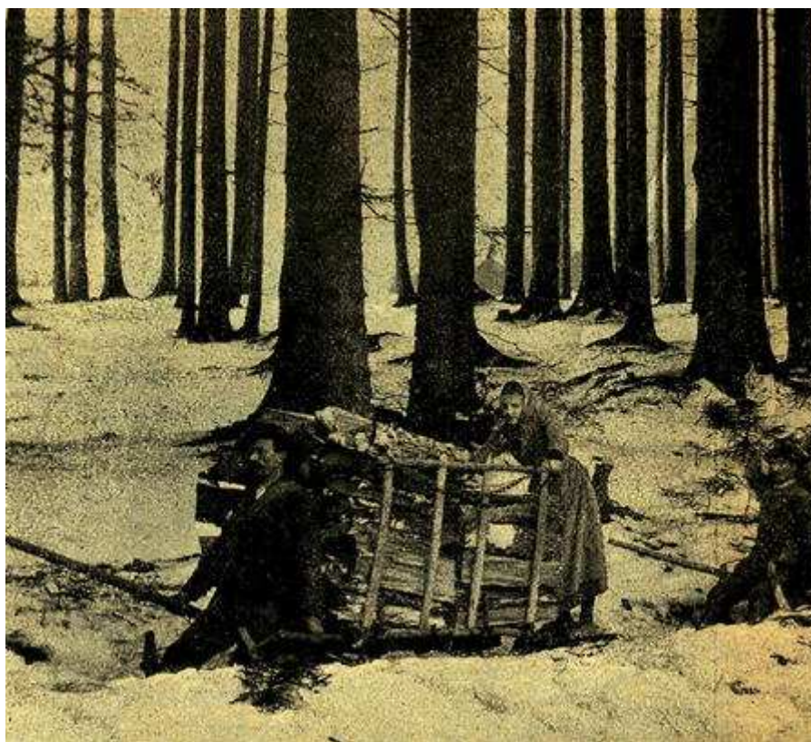
Obr. 2. Hromadná jízda s nákladem s vrchu

V rodinném životě jest muž ve všem všudy hlavou, žena jest mu opravdu poddána, nemajíc a také nehledajíc předností a výhod ani strojených, ani skutečných.