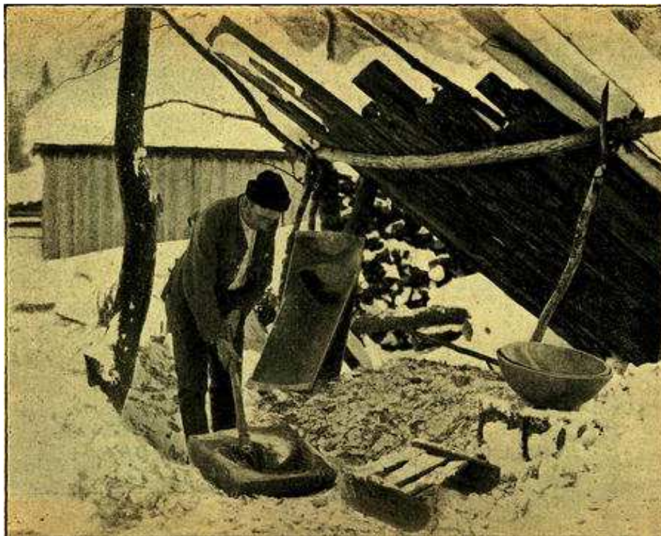
Obr. 5. Výroba okřínů. Počátek práce. (Ke článku J. F. Hrušky: Chodský dřevorubec a jeho práce.)