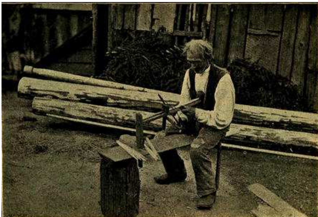
Obr. 8. Břetenář. (Ke článku J. F. Hrušky: Chodský dřevorubec a jeho práce.)