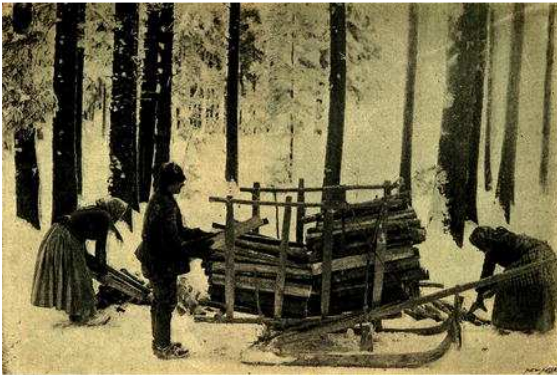
Obr. 1. „Jedny sáně“, nakládání. (Ke článku J. F. Hrušky: Chodský dřevorubec a jeho práce.)

Žena dřevorubcova jest pravá jeho „pomocnice, podobná jemu“. Jsouc s mužem ruku y ruce nejen v těžké práci za krušným, těžkým výdělkem, nýbrž i majíc nad to ve starostech o rodinu, o domácnost svůj zvláštní vlastní díl v dobývání vezdejšího chleba, má žena dřevorubcova dosti příčiny a příležitosti k témuž tužení těla i ducha, k témuž prostému živobytí, k téže soucitnosti pro trpící a strádající, k téže tvrdosti proti křivdě a násilí, k téže živosti u veselí; při tom všem nepřestává ovšem býti vůči svému muži ženou, ale vůči jiným ženám, mnohým ženám jest pravým mužem.