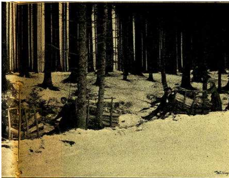
(Ke článku J. F. Hrušky: Chodský dřevorubec a jeho práce.)

Jedna rána sekerou z tisíce nutných může kolikráte celé dílo zkazit (Vyobrazení č. 5., 6.)