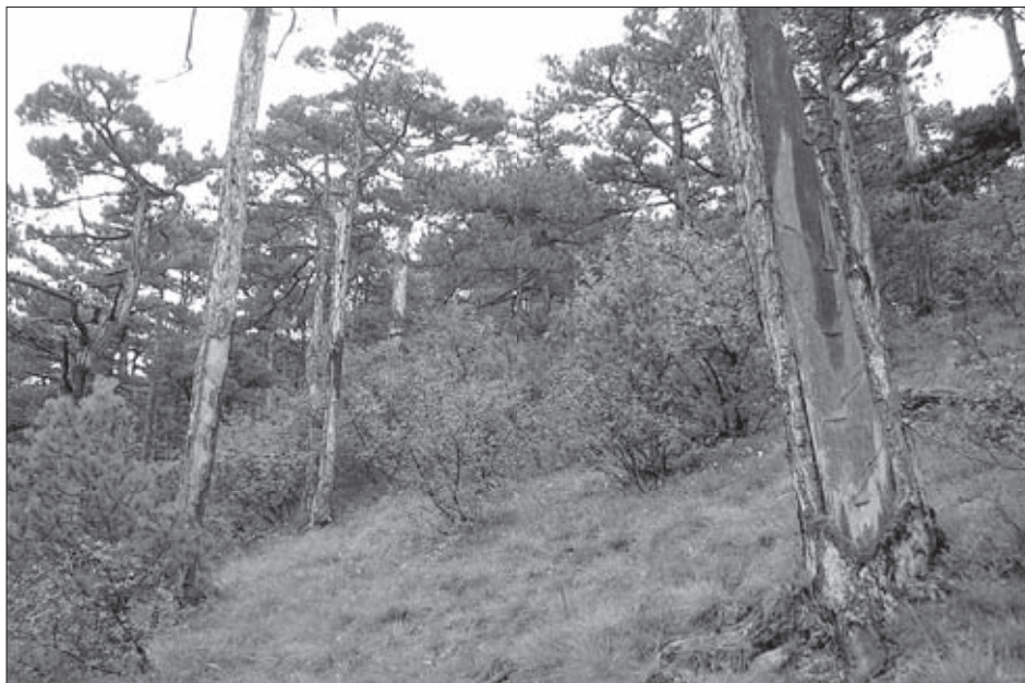
Typický středoevropský utmark – extrémně svažité alpské stráně využívané k intenzivnímu smolaření na borovicích černých, které je dodnes indikováno pozůstatky tzv. lizin na kmenech stromů. Údolí Helenental, Baden, Rakousko. Foto J. Woitsch, 2008.