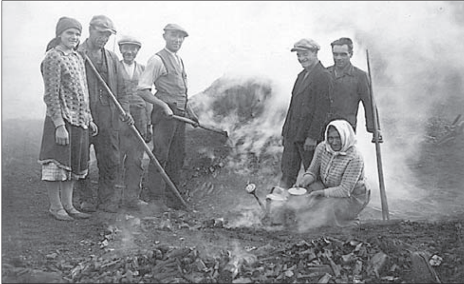
(Obr. nahoře a dole) Poslední generace profesionálních uhlířů působily na našem území ještě ve 20. století. Uhlířské pracoviště se stojatými milíři provozované rodinou Forchtsamových poblíž pily v Březinách u Poličky (okr. Svitavy). 30. léta 20. století.